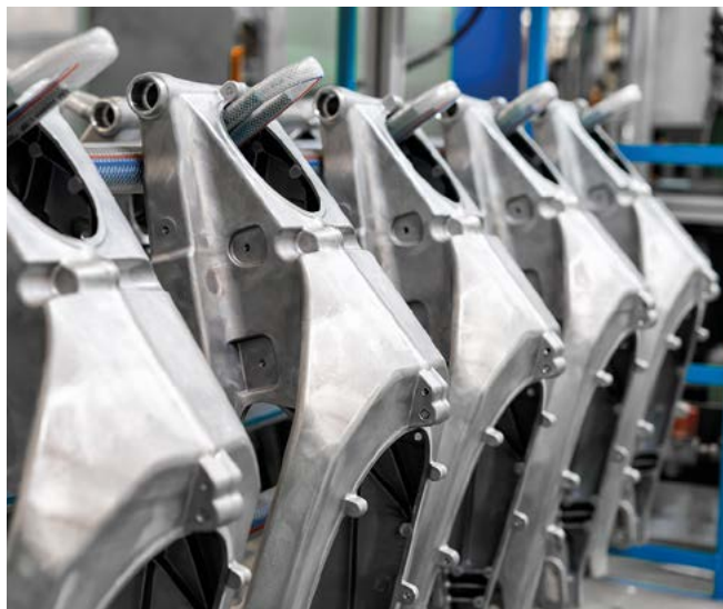
Piezas de coche de aluminio, proceso de fundición en una fábrica del sector de la automoción